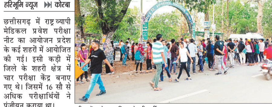
परीक्षा केंद्र से बाहर निकलते परीक्षार्थी।

छत्तीसगढ़ में राष्ट्र व्यापी मेट्रिकल प्रवेश परीक्षा नीट का आयोजन प्रदेश के कई शहरों में आयोजित की गई। इसी कड़ी में जिले के शहरी क्षेत्र में चार परीक्षा केंद्र बनाए गए थे। जिसमें 16 सौ से अधिक परीक्षार्थियों ने पंजीयन कराया था। इस वर्ष अधिकांश परीक्षा केंद्र सरकारी और सरकारी सहायता प्राप्त स्कूलों, कॉलेजों, विश्वविद्यालयों और संस्थानों में पड़े हैं जिसमें छात्र