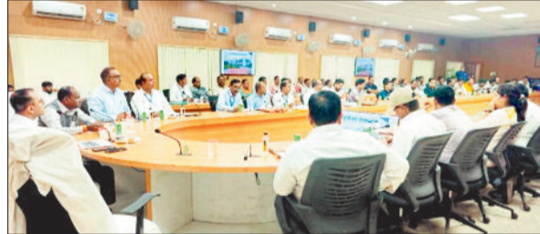
बैठक के दौरान अधिकारियों को निर्देश देते कलेक्टर।

एएसईएल दीपका परियोजना के द्वारा कोयला उत्खनन के लिए कोयला खदान विस्तार हेतु अधिग्रहित ग्राम हरदीबाजार को