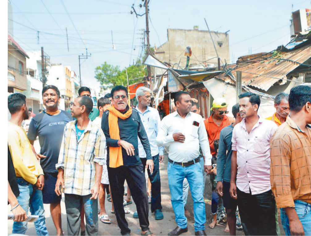
टिकरापारा में कार के ऊपर पेड़ टूटकर गिरने से मोहल्लेवासियों ने जमकर हंगामा मचाया।