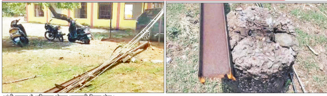
आंधी तूफान में क्षतिग्रस्त होकर धराशायी विद्युत पोल।

हो गए थे। साथ ही कई स्थानों में ट्रांसफार्मर ब्रस्ट होने की वजह से विद्युत व्यवस्था पूरी तरह से अस्त-व्यस्त हो गई थी। देर शाम बारिश रुकते ही विद्युत विभाग के अधिकारी कर्मचारी एक-एक करके विद्युत व्यवस्था बहाल करने में निकले। जहां जगह-जगह धराशायी हुए पेड़ों को काटने में ही पूरा रात निकल गया। कई इलाकों में किसी तरह देर रात को विद्युत व्यवस्था को बहाल किया जा सका लेकिन ज्यादातर इलाके में अंधेरा छाया रहा। सुबह फिर से विद्युत विभाग की टीम ने अभियान शुरू किया और शहर के तुलसीनगर जौन, पाड़ीमार जौन और दर्री जौन में अलग-अलग टीम विद्युत व्यवस्था को बहाल