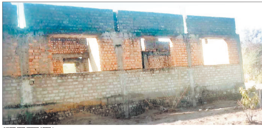
अधूरा पड़ा स्कूल भवन।

ग्रामीण अंचलों में ग्राम पंचायतों के माध्यम से कराए जाने वाले निर्माण कार्य अधूरे रहने और सरकार की राशि का दुरुलयोग होने के मामले