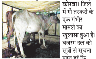
कोरबा। जिले में गौ तस्करी के एक गंभीर मामले का खुलासा हुआ है। बजरंग दल को सूत्रों से सूचना प्राप्त हुई कि

इमलीदुगु, सीतामणी चोक क्षेत्र से एक वाहन के माध्यम से गौ-वंश की अवैध तस्करी की जा रही है। प्राप्त सूचना के आधार पर शनिवार की रात्रि 11.45 बजे बजरंग दल के सदस्य मौके पर पहुंचे। इस दौरान वाहन क्रमांक सीजी 12 बीएल 4143 में दो बैल को बांधकर ले जाया जा रहा था। जब वाहन चालक उन्होंने पू तो उसने कोई उतर नहीं दिया और अपनी पहचान छिपाने का प्रयास करता रहा। इस घटना के बाद विश्व हिन्दू परिषद ने कोतवाली थाना प्रभारी को लिखित में शिकायत सौंपते हुए मांग की है कि इस प्रकार की गौ-तस्करी व पशु चराने के मामलों में तत्काल कड़ी कार्रवाई की जाए।