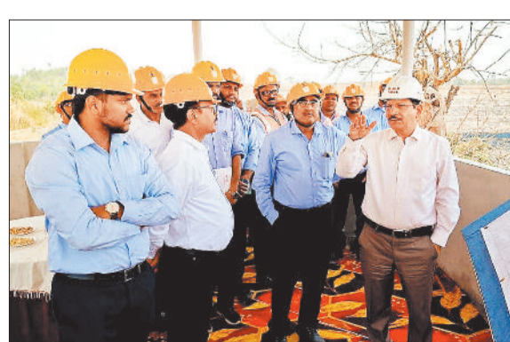
अधिकारियों को दिशा निर्देश देते सीएमडी।